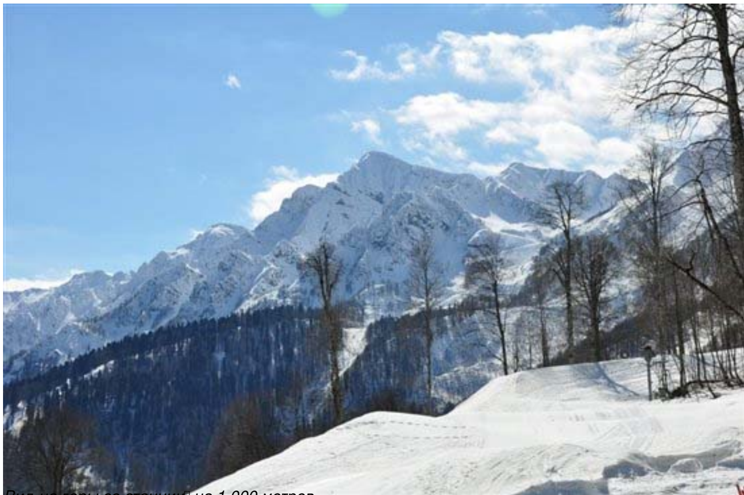
Вид на горы со станции на 1,000 метров