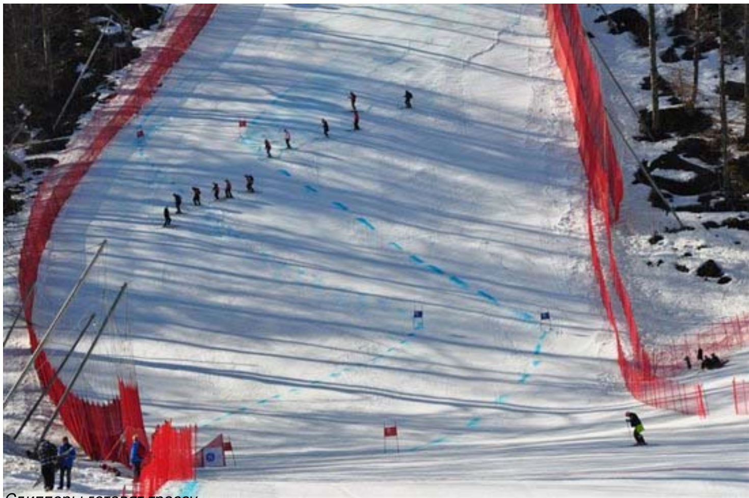
Слипперы готовят трассу