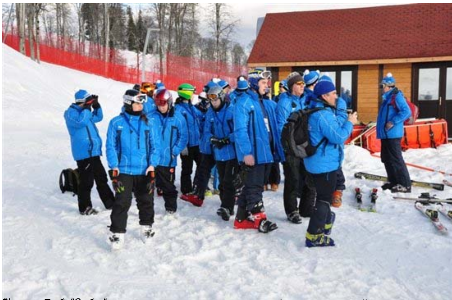
На фото: Девы "Сибиряки" и другие спортсмены судно и др. в рамках профессионального управления и деятельности