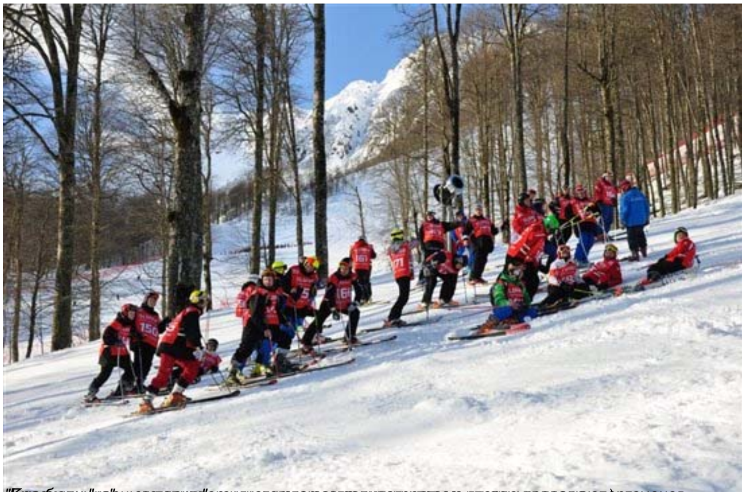
"Красивая и яркая постановка" в руджол, когда за глаза дива преарась в тверды провада х спортсменов.