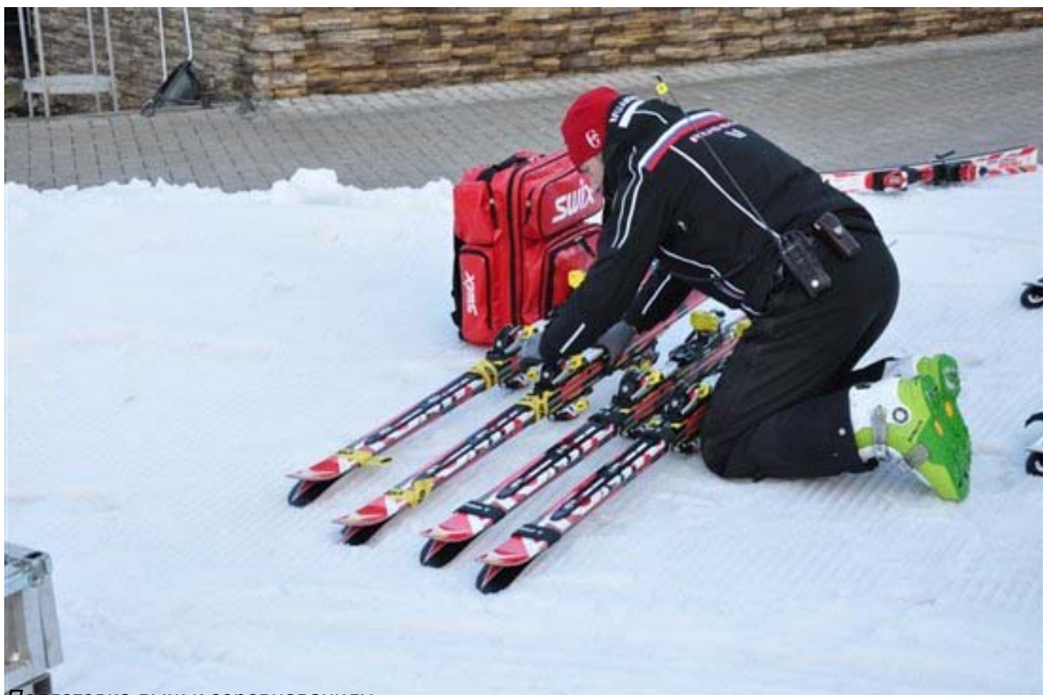
Подготовка лыж к соревнованиям