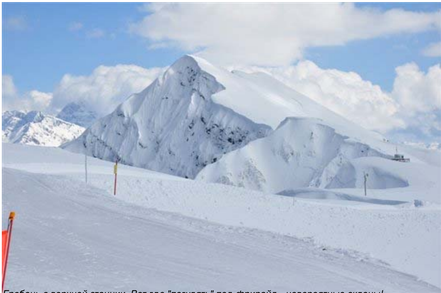
Гребень с верхней станции. Вот где "погулять" под фрирайд - невероятные склоны!