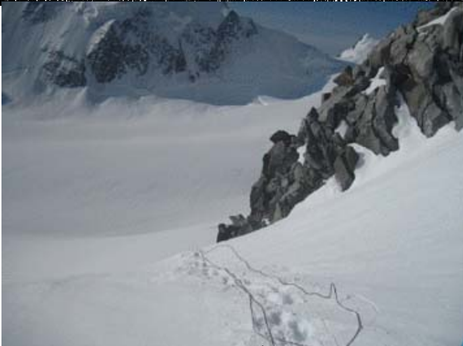
Белуха (Белуха) - один из самых красивых горных районов Республики Алтай