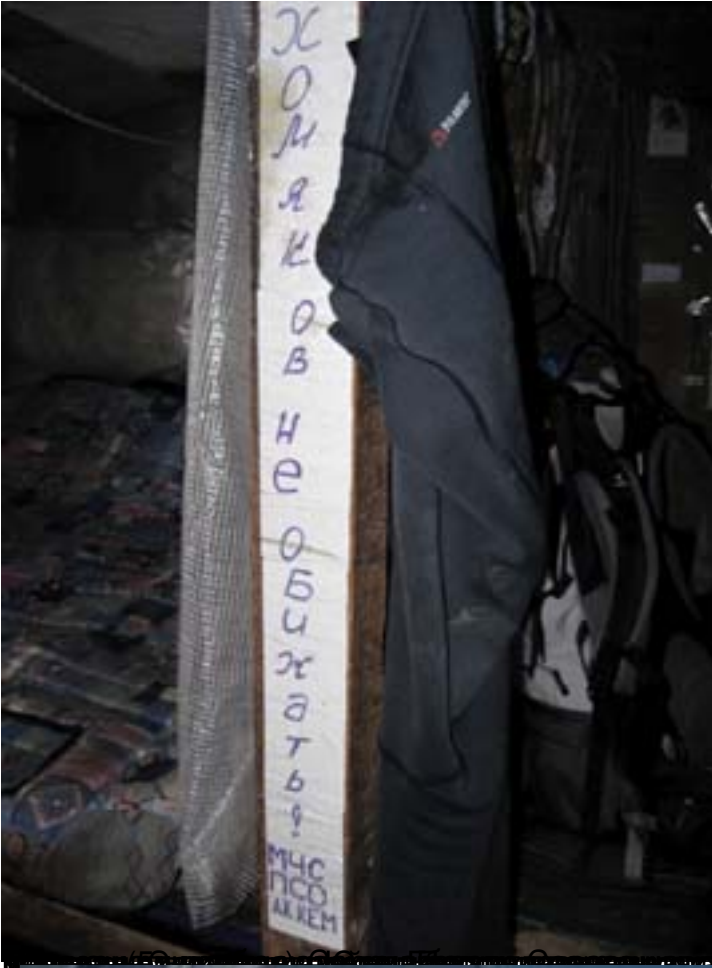
Белуха (Белуха) - один из самых красивых горных районов Республики Алтай

26.06.2012 10:36 - Обновлено 29.06.2012 22:04